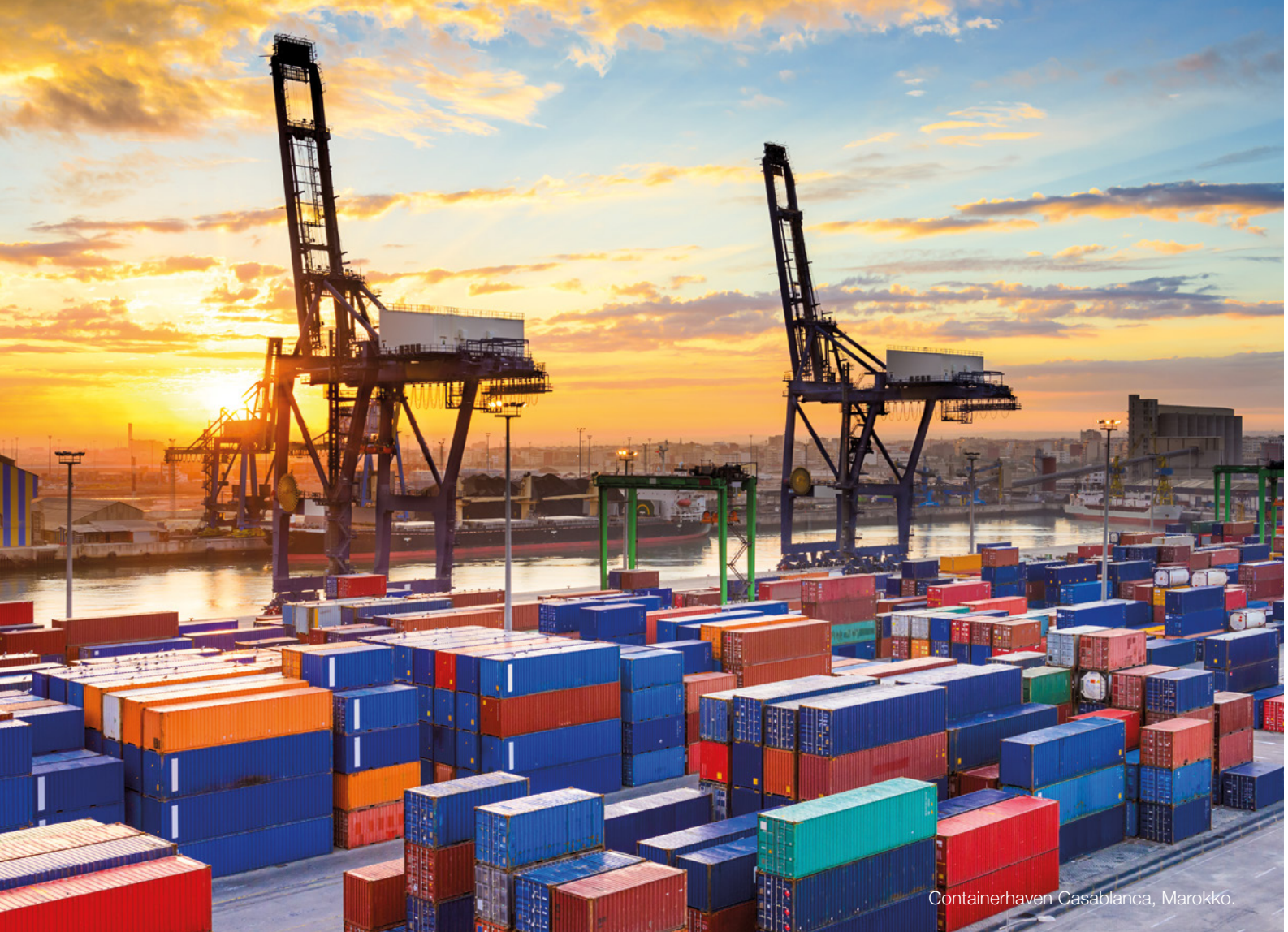
Containerhaven Casablanca, Marokko.

ning Mohamed VI ontsloeg diverse ministers en topambtenaren en drong aan op het versneld uitvoeren van overheidsprogramma's in de Rif.