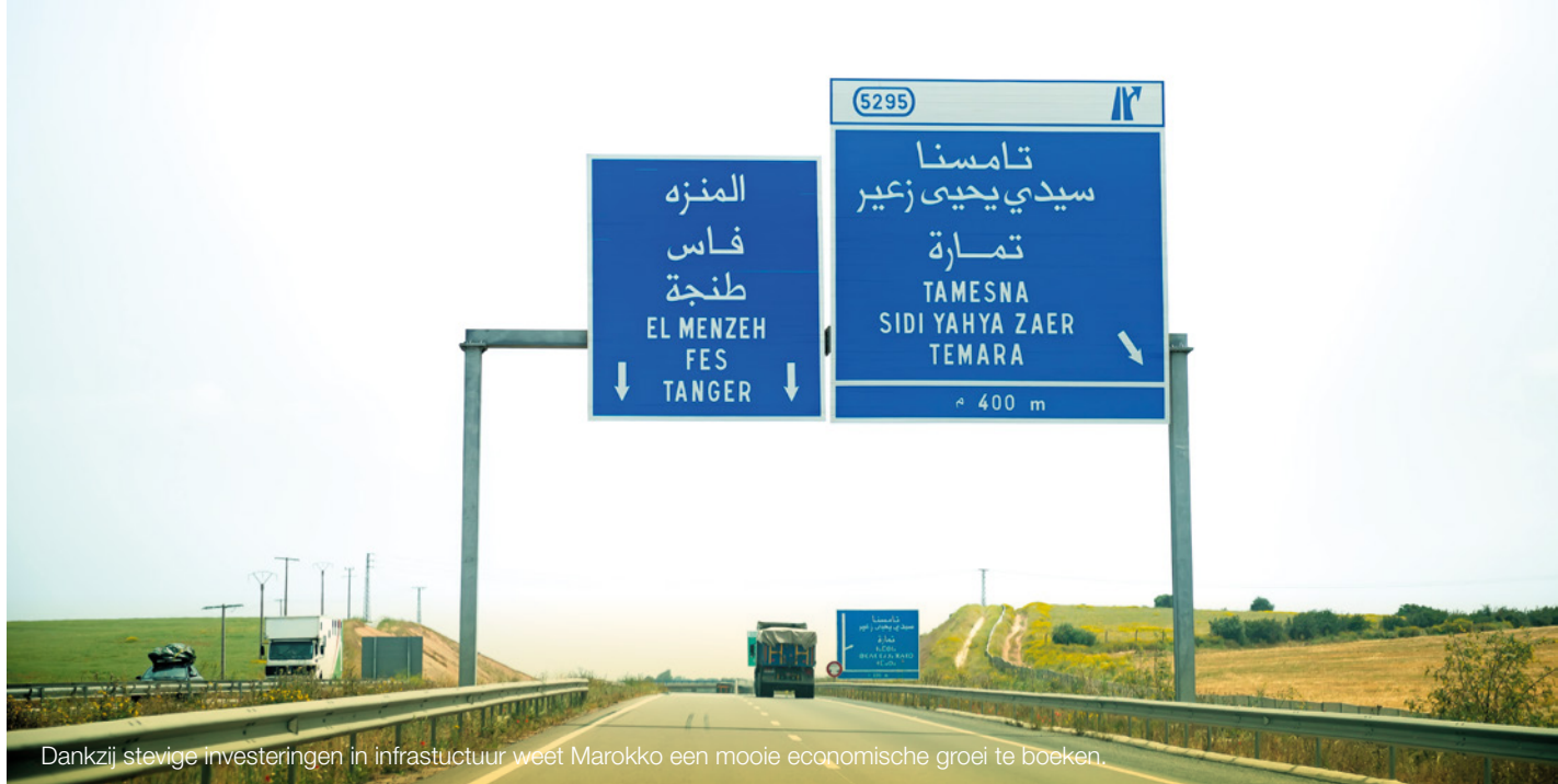
Dankzij stevige investeringen in infrastructuur weet Marokko een mooie economische groei te boeken.